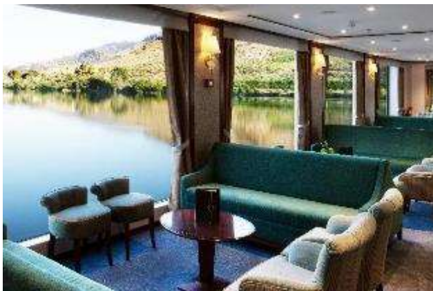
Salon - Bar