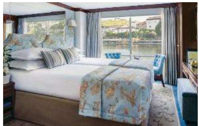
Cabine Deluxe Baie vitrée pont Supérieur