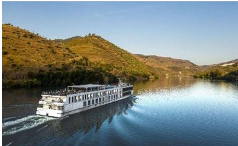
A bord du M/S Queen Isabel *****

16 au 23 juillet 2023 23 au 30 juillet 2023