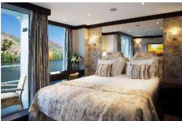
Cabine Deluxe Balcon pont Panorama