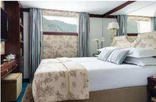
Cabine Confort Fenêtre pont Principal

Les 59 cabines du bateau sont toutes extérieures et réparties sur 3 ponts. Au pont Principal, les 16 cabines Confort ont une superficie de 15 m 2 et sont équipées d'une fenêtre haute (qui ne s'ouvre pas). Le pont Supérieur dispose de 23 cabines Deluxe de 15 m 2 , avec large baie vitrée ouvrable. Au pont Panorama, 18 cabines Deluxe Balcon d'une superficie de 20 m 2 et 2 Junior Suite d'une superficie de 30 m 2 disposent d'un balcon privatif équipé d'une table et de fauteuils. Toutes les cabines sont équipées de 2 lits pouvant être rapprochés ou séparés, climatisation individuelle, télévision, sèche-cheveux, coffre-fort, salle de douche et WC. Les Junior Suite disposent d'un coin salon.