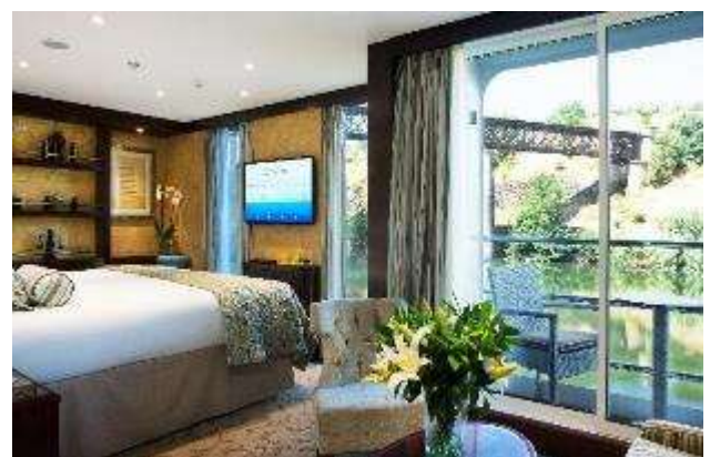
Junior Suite Balcon pont Panorama